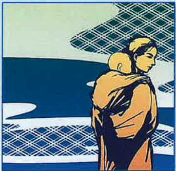
▷ 子守唄の里 高屋