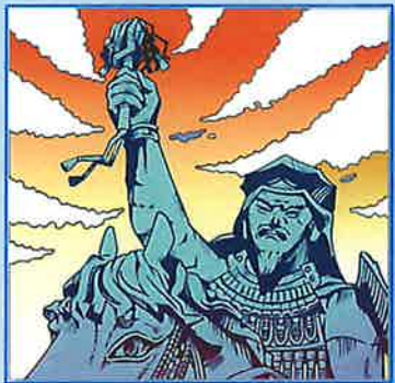
▷ 早雲の里 荏原