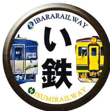
「い鉄」コラボヘッドマーク